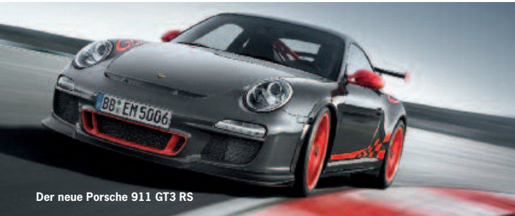
Der neue Porsche 911 GT3 RS

4 Fahrspaß pur. Faszination Porsche auf dem Nürburgring.