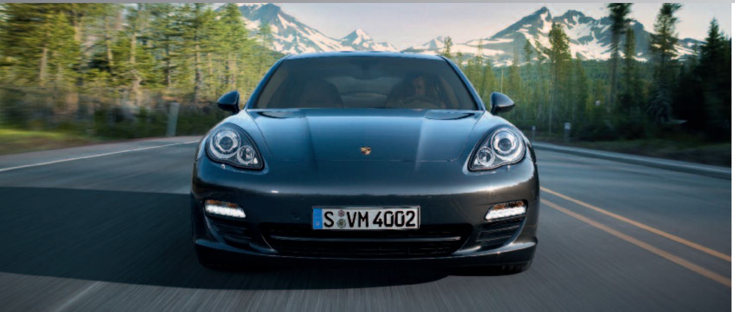
Der Panamera bei seiner Weltpremiere in Shanghai am 19. April 2009.